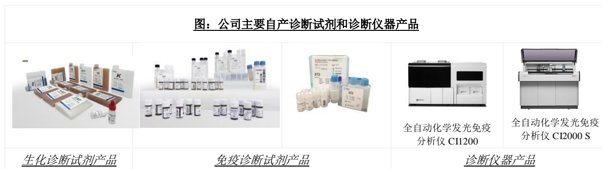
图：公司主要自产诊断试剂和诊断仪器产品

公司在生物化学原料领域产品包括生物酶、辅酶、抗原、抗体、精细化学品等各种试剂，应用范围涵盖生物科技、临床诊断和化工生产等多个方面。公司是国内极少数掌握诊断酶制备技术的诊断试剂生产企业之一。全资子公司阿匹斯通过借助利德曼多年积累的体外诊断行业渠道、国内各级医疗机构以及科研机构资源，可以服务于体外诊断、临床诊断与医疗、生命科学、食品检测等专业领域的企业、大学、科研院所。